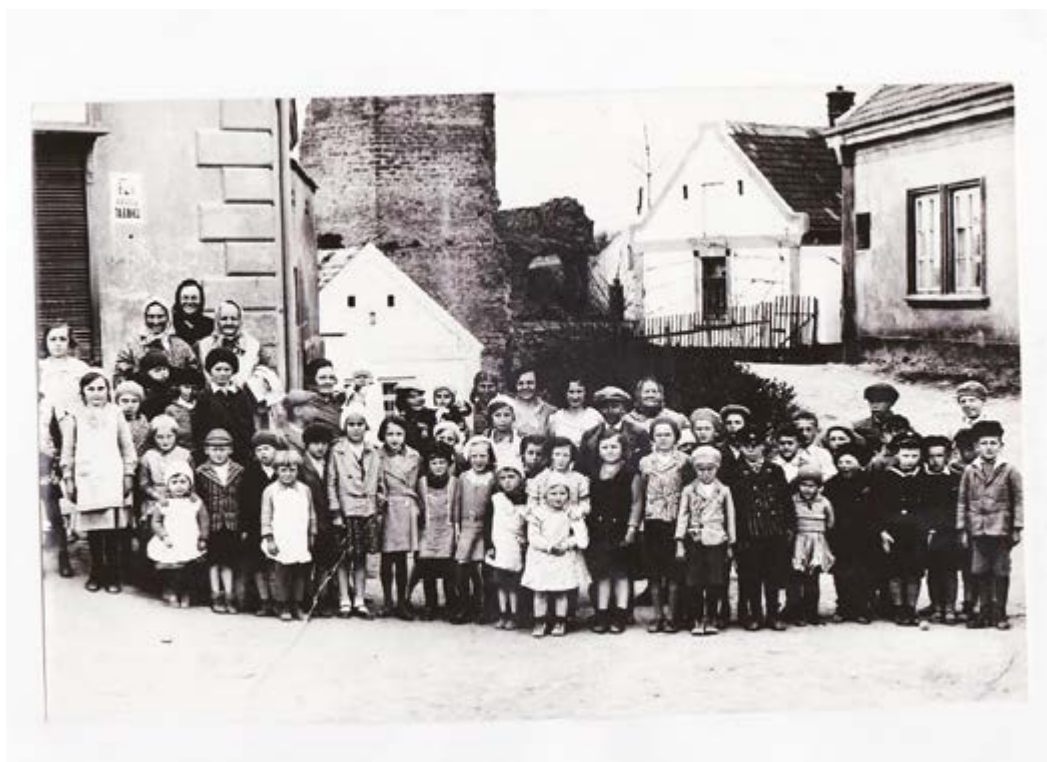
Obyvatelé Jenštejna v roce 1933, archiv.