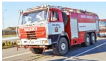
Polygon v Hradci Králové

litelů družstva a strojníků zúčastnilo pravidelné odporné přípravy pořádané HZS ve Staré Boleslavi. Součástí přípravy bylo mimo jiné nácvik čerpání vody z Labe, vyhledávání osob v zakouřeném prostoru nebo práce s komunikačními prostředky. V květnu se pak šest našich členů zúčastnilo výcviku v ohňovém kontejneru Fire Dra-