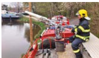
Výcvik velitelů a strojníků Stará Boleslav

litelů družstva a strojníků zúčastnilo pravidelné odporné přípravy pořádané HZS ve Staré Boleslavi. Součástí přípravy bylo mimo jiné nácvik čerpání vody z Labe, vyhledávání osob v zakouřeném prostoru nebo práce s komunikačními prostředky. V květnu se pak šest našich členů zúčastnilo výcviku v ohňovém kontejneru Fire Dra-