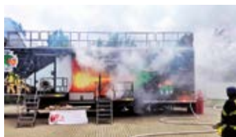
Cvičení v ohňovém kontejneru

V březnu se tři naši řidiči s cisternou Tatra 815 zúčastnili na hradeckém polygonu kurzu jízdy za ztížených podmínek včetně nácviku zvládnání krizových situací. Zde bych rád doplnil, že si jeden z našich členů na jaře úspěšně rozšířil řidičské oprávnění o skupinu C a máme tedy v současnosti k dispozici celkem 5 řidičů cisterny. V dubnu se sedm z našich ve-