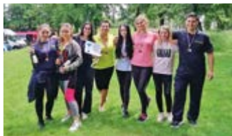
Soutěž v požárním útoku Stará Boleslav

gon 7000 společnosti Dräger. Jedná se o mobilní kontejner k nácviku simulací požárů v uzavřených prostorech včetně nebezpečných jevů jako je rollover. Kurzy na polygonu a v kontejneru jsme absolvovali díky našemu členství v Asociaci velitelů JSDH a primárně se ho účastnili jednotky z vyšších kategorií, než je ta naše.