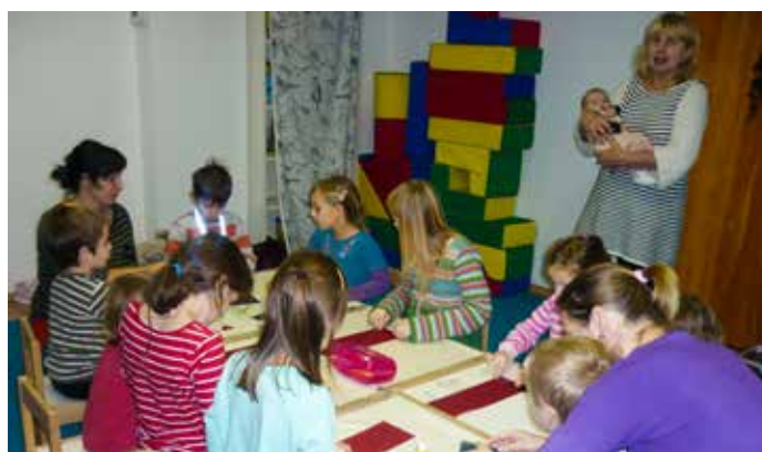
Výtvarná dílnička s pohádkou