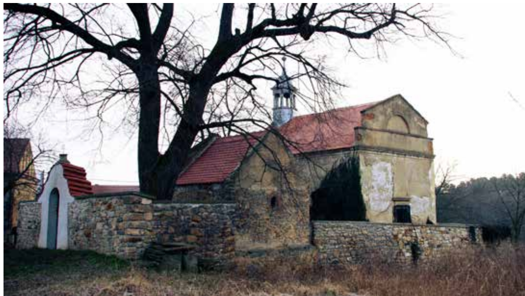
Kostel stěti Sv. Jana Křtitele ve Cvrčovicích (J. Hulík / únor 2015)

napsat „naš kostel“ - Kostel stěti Sv. Jana Křtitele ve Cvrčovicích (nejstarší část obce) je nyní, po stavební rekonstrukci střechy, zasklení oken, opravě střechy márnice a vystavění krásné zdi kolem kostela ve stavu, kdy můžeme v klidu říci, že jsme jej dostali z nejhoršího.