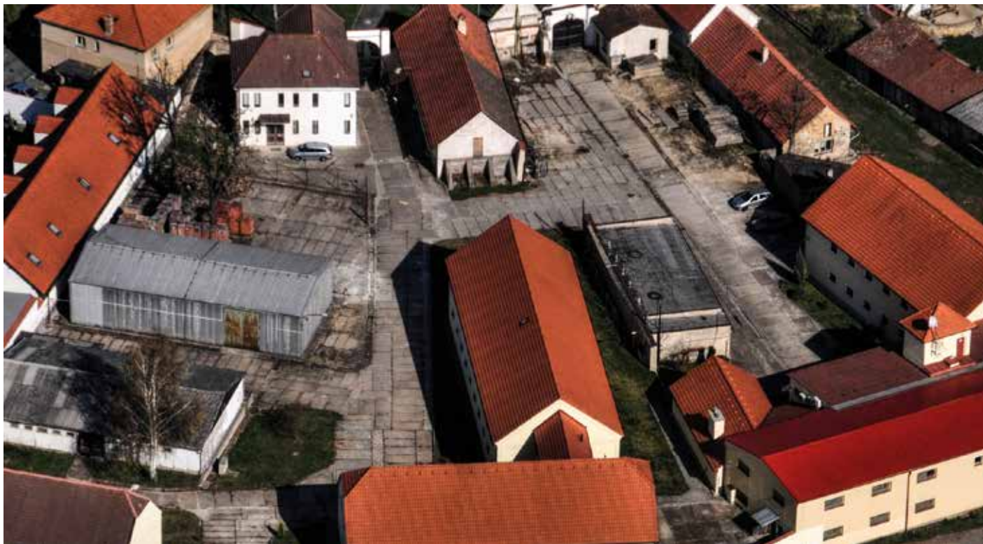
Areál Knihovny Akademie věd

Depozitář knih Jenštejn – historie a současnost