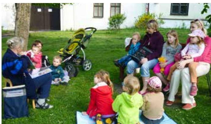
Čtení na návsi