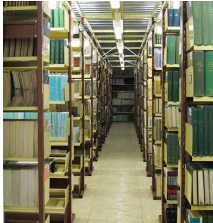
Areál Knihovny Akademie věd v Jenštejně

Knihovna Akademie věd chrání knihy v klasické i digitální podobě