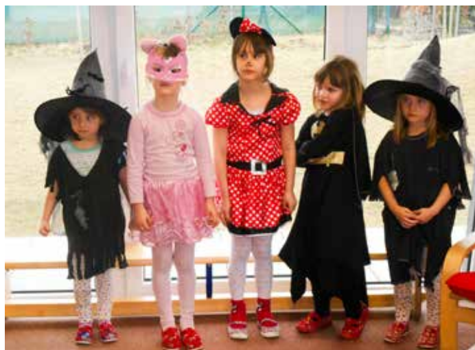
Karneval ve školce 2015