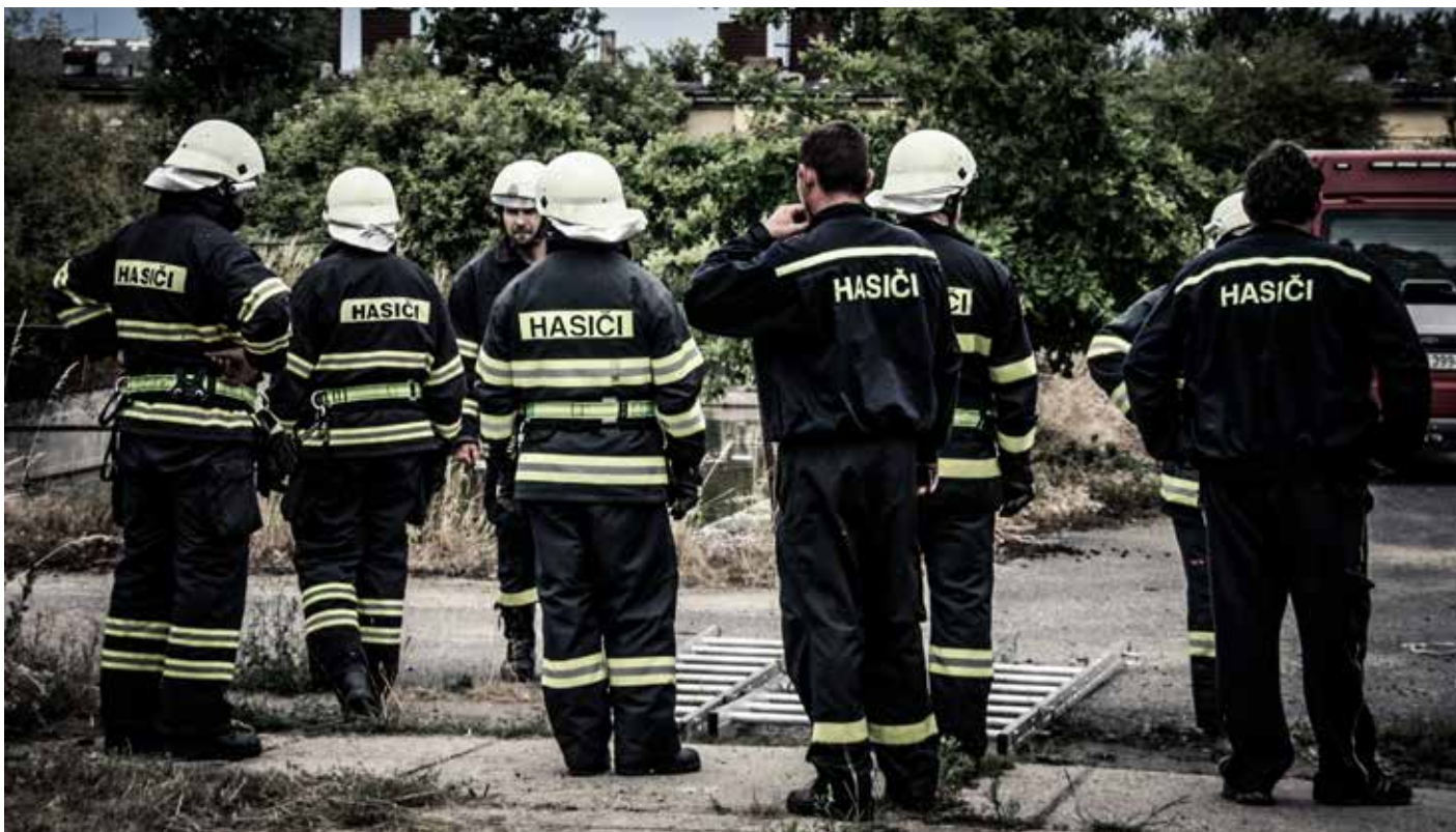
Memoriál Vladimíra Nuemana 2014 (červen 2014)