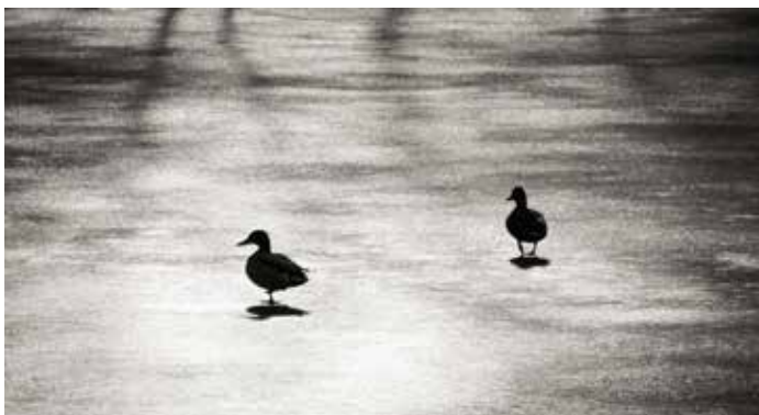
Letošní zima-nezima (únor 2015)