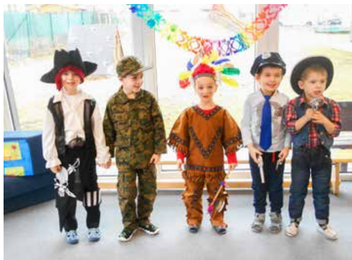
Karneval ve školce 2015