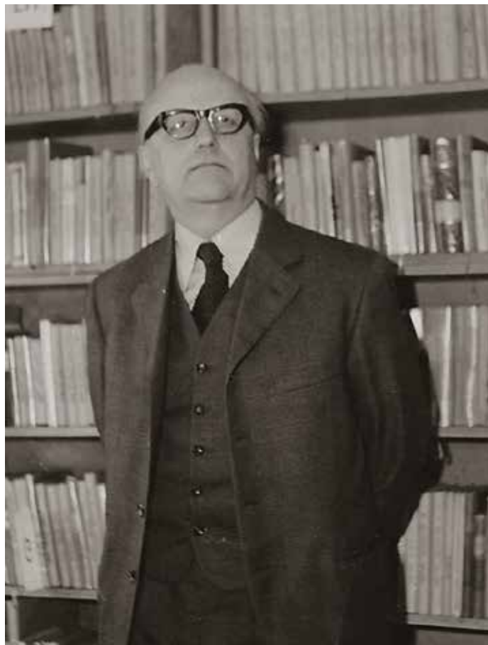
Eduard Petiška v obecní knihovně v roce 1978