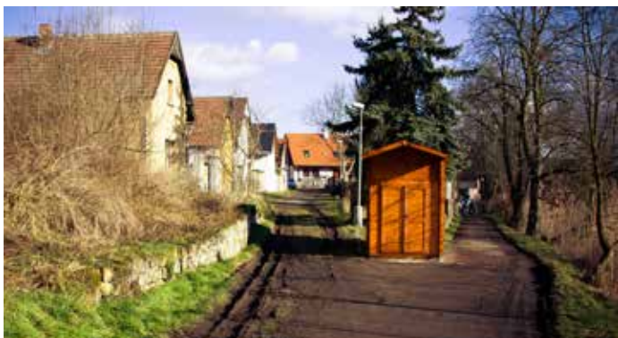
Přístřešek pro nové čerpadlo k ČOV (únor 2015)