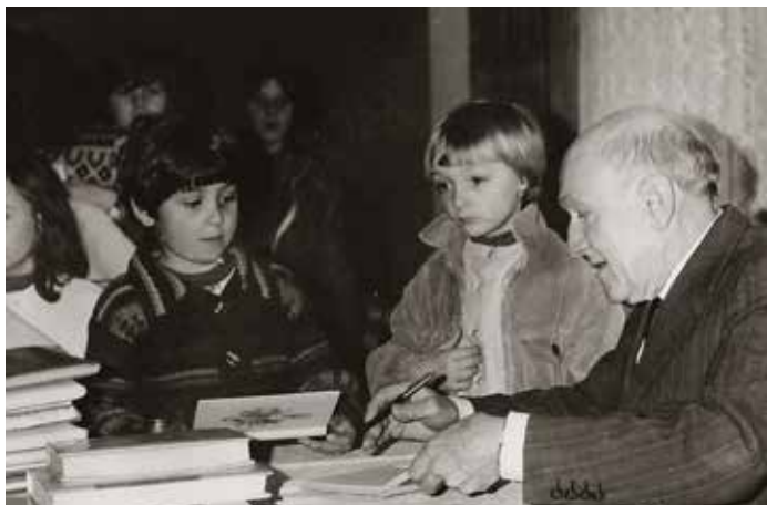
František Filipovský v Jenštejně v roce 1982 (foto archiv V. Kovandy)

Obecní knihovna existuje v Jenštejně už od první poloviny dvacátého století