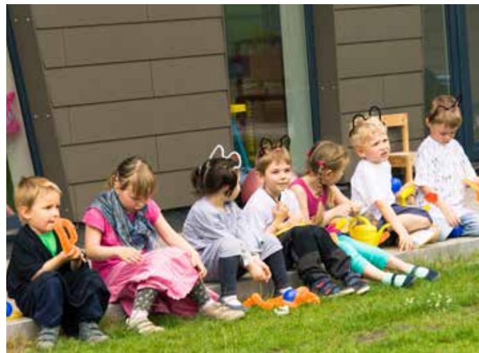
Trpaslíkův den 2014 (květen 2014)